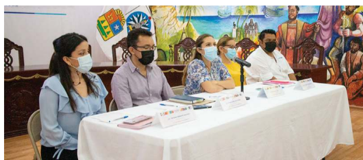
LA ADMINISTRACIÓN anterior dejó de pagar 8 mdp del porcentaje de Zofemat al Estado y Federación; se suma a los 140 mdp faltantes que ya se habían detectado antes.

"Acciones como esta nos ver el desamor con el que se gobernó, la afectación no es para quienes hoy estamos aquí al frente dando la cara, es para el pueblo de Isla Mujeres", señaló. (Redacción)