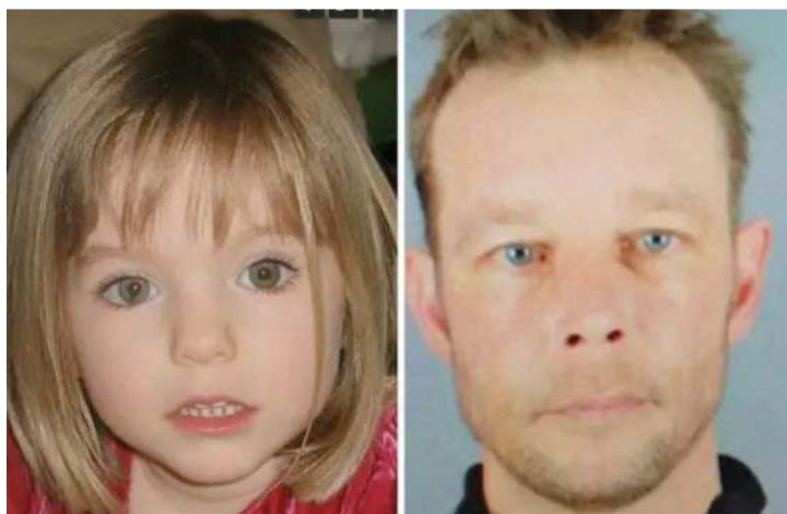
EL PEDÓFILO alemán Christian Brueckner, preso por otros casos, es el principal sospechoso de la desaparición y asesinato de la menor, un caso abierto desde 2007.

Reclaman desbloqueo de cuentas bancarias y Washington exige detener terrorismo