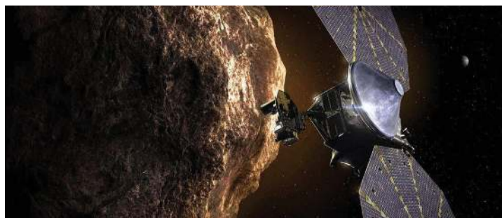
LA ESPERANZA es que una futura civilización humana encuentre el mensaje de la nave espacial, que será lanzada en octubre por la NASA.

La misión de Lucy se centra en los asteroides troyanos, un grupo de rocas espaciales que orbitan alrededor del Sol más allá del anillo del cinturón de asteroides, girando hacia Júpiter o persiguiendo al gigante gaseoso en su propia órbita solar. Lucy (llamada así por el homínido fósil, a su vez bautizada por la canción de los Beatles "Lucy in the Sky with Diamonds") está apuntando a siete de ellos para sobrevolarlos en el transcurso de 12 años. (Agencias)