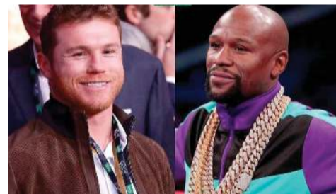
'MONEY' VUELVE a la carga, afirma que "no puede alimentar a su familia solo con decir 'te amo'".

"No podemos alimentar a nuestra familia simplemente diciendo 'te amo'".