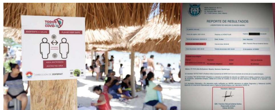
GOBIERNO ARGENTINO investigará si pruebas realizadas a estudiantes eran falsas; reportan 25 estudiantes aislados en Cancún; autoridades sanitarias suspenden a laboratorio involucrado.

Por otra parte, el gobierno de Quintana Roo confirmó que la Secretaría de Salud Estatal, a través de la Dirección de Protección Contra Riesgos Sanitarios, aplicó una suspensión provisional del laboratorio Marbú Salud, en tanto se llevan a cabo las investigaciones correspondientes derivadas del caso de más de casi un centenar de jóvenes argentinos que visitaron Cancún. (Redacción)