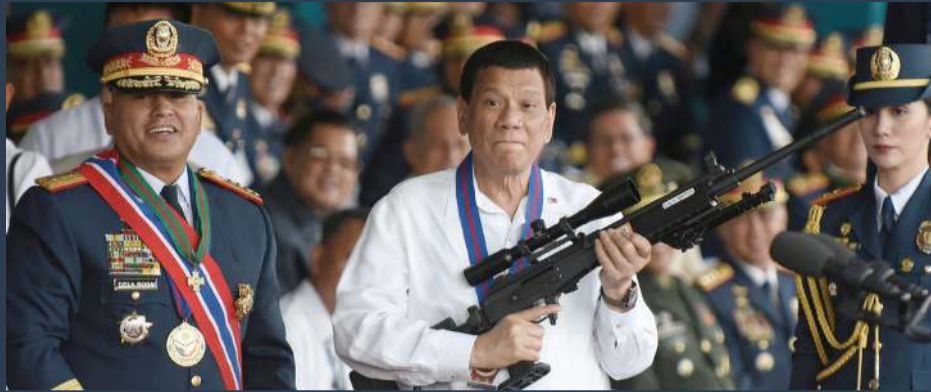
HUMAN RIGHTS Watch denuncia sangrientas redadas contra comunistas; “mátenlos a todos”, había ordenado Duterte.

recen ser parte de un plan coordinado por las autoridades para asaltar, arrestar e incluso matar a activistas en sus hogares y oficinas” y forman “claramente parte de la cada vez más brutal campaña del gobierno destinada a eliminar la insurgencia comunista”, que ya “no distingue entre rebeldes armados y activistas no combatientes, líderes laborales y defensores de los Derechos Humanos.