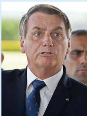
PERSONALIDADES CRITICAN al ultraderechista presidente de Brasil por mal manejo de la pandemia en una “carta abierta a la humanidad”.

Hacen un llamado a la Conferencia Nacional de Obispos, al Congreso de su país y a la Organización de Naciones Unidas, entre otras instancias, a condenar “urgentemente la política genocida de ese gobierno que amenaza a la civilización”. (La Jornada)