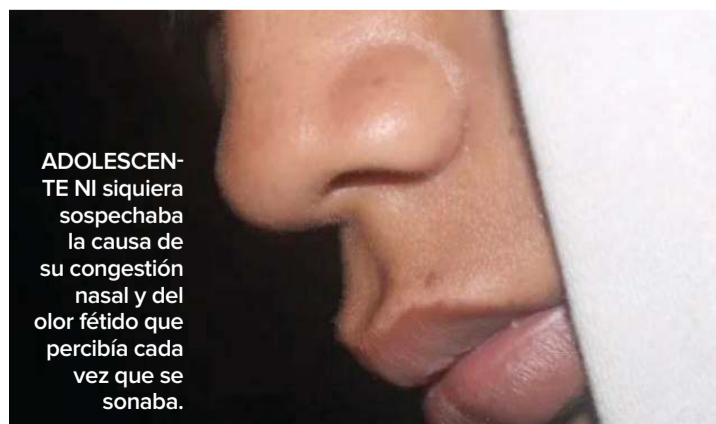
ADOLESCENTE NI SIQUERA sospechaba la causa de su congestión nasal y del olor fétido que percibía cada vez que se sonaba.

El procedimiento quirúrgico eliminó el olor desagradable. De acuerdo con Dylan Z. Erwin, coautor del estudio, un objeto extraño puede causar esa condición al ser capaz de bloquear las “vías de drenaje naturales” de la nariz y desencadenar la acumulación de “moco, bacterias y desechos inhalados”. No obstante, esta condición no siempre manifiesta síntomas propios de una infección (fiebre, inflamación, etcétera), lo que dificulta su diagnóstico. (Agencias)