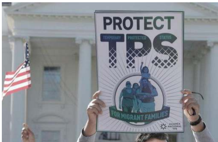
EL AMPARO migratorio con estatus de protección temporal permitirá a quienes ya se encuentran en EEUU trabajar y residir legalmente por los próximos 18 meses.