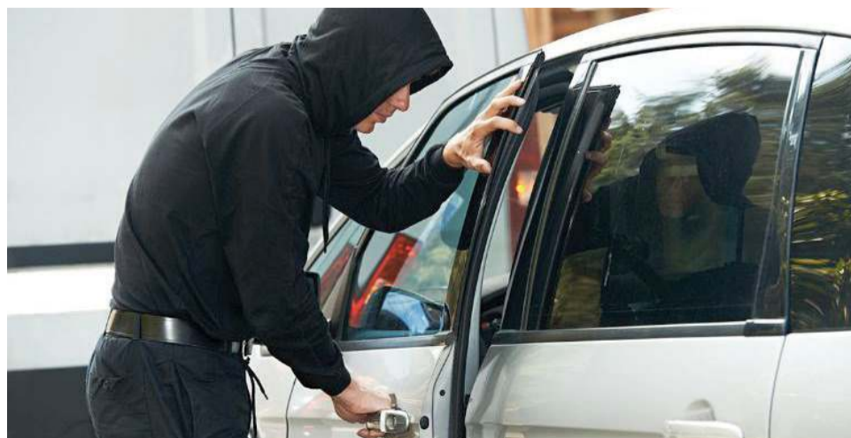
SIETE DE cada 10 unidades aseguradas fueron robadas en el 2020 en seis estados del país, encabezado por el Estado de México; Versa, el auto más "solicitado".

Como es costumbre desde el 2017, el listado de vehículos más robados está encabezado por el Versa, seguido de la camioneta NP300, continuado por el Aveo, el Tsuru y el Vento. (Agencias)