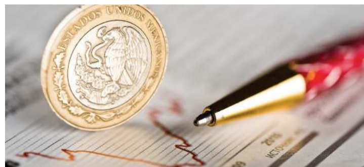
CAE EL nivel de los precios de las gasolinas, agropecuarios y transporte aéreo principalmente.

También durante noviembre la gasolina de tipo Premium mostró una caída en su nivel de precios de 3.64% respecto del nivel registrado en octubre. El transporte aéreo, por su parte, se abarató 5.78% durante este lapso. (Agencias)