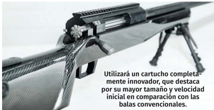
Utilizará un cartucho completamente innovador, que destaca por su mayor tamaño y velocidad inicial en comparación con las balas convencionales.