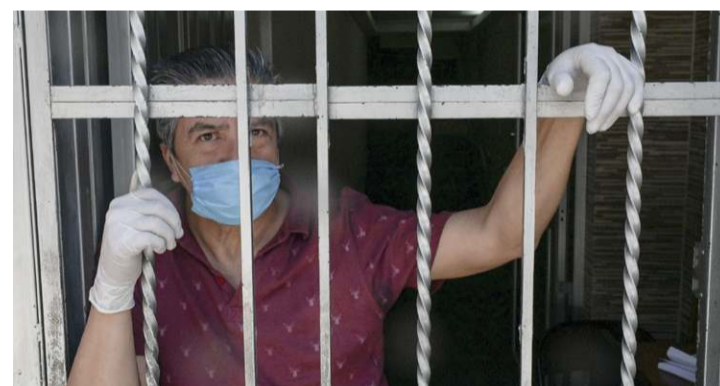
El nivel de credibilidad sobre la información gubernamental en torno a la pandemia bajó del 65 al 59 por ciento.