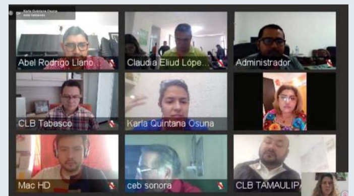
Participará Quintana Roo en foros regionales virtuales: convocan a familiares de víctimas y colectivos de búsqueda.

Sin embargo, los interesados en robustecer el Protocolo Homologado podrán seguir el desarrollo de los foros regionales virtuales a través de Facebook Live, donde, incluso, podrán dar a conocer sus sugerencias. En el caso de Quintana Roo, la actividad se realizará el próximo día 21.