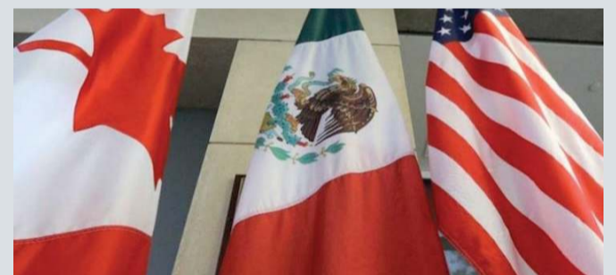
Demandas en el tema laboral son inaceptables: CCE; proponen mediación de Canadá; se aprueba esta semana o se va hasta 2020: Senado estadounidense.

Por ejemplo, del total de los subsidios entregados entre 2013 y 2018 por la Comisión Nacional de Vivienda (Conavi), 66% fueron dirigidos hacia la adquisición de vivienda nueva y los estados que más subsidios recibieron fueron Nuevo León, Jalisco, Puebla y Quintana Roo con 10%, 10%, 6% y 5% respectivamente.