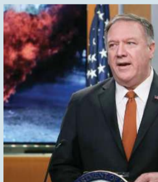
Acusa a Cuba y Venezuela de intentar sacar provecho de las protestas democráticas en distintos países.

"Desde enero, hemos dicho que todas las opciones están sobre la mesa para ayudar al pueblo venezolano a recuperar la democracia y la prosperidad. Eso es desde luego todavía verdad, pero hemos aprendido de la historia que los riesgos de usar la fuerza militar son significativos", dijo Pompeo.