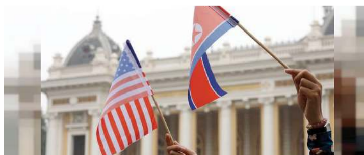
Se acerca el límite del plazo, advierte a EEUU; de Washington dependerá el tipo de "regalo de navidad" que quiera obtener.

El país asiático también demanda a Washington que abandone su "política hostil" contra el régimen norcoreano y elabore una propuesta aceptable.