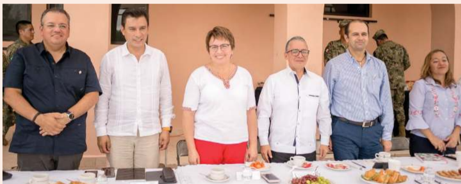
Celebran mesa en Playa del Carmen autoridades federales, estatales y municipales.

Lo anterior debido a que se cumplen las condiciones climáticas que existen en otros estados como Tabasco en donde las tarifas eléctricas aplicables son más económicas que las que existen en Quintana Roo, entidad que también sufre los efectos de las altas temperaturas.