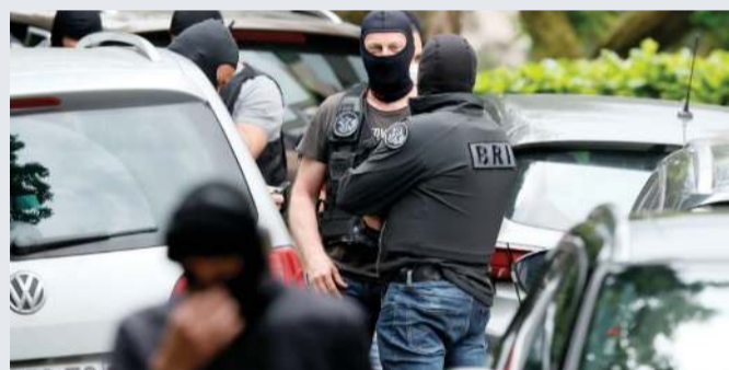
Fue arrestado, junto con su madre y un amigo, por elementos de la policía francesa; el ataque con un explosivo casero, dejó 13 heridos.

LONDRES.- Tras el anuncio de su renuncia, el pasado viernes, por no haber concretado el brexit, suman ya ocho aspirantes a suceder a la aún primera ministra británica, Theresa May: el ministro de Salud, Matt Hancock; el exministro de Brexit, Dominic Raab; la exlíder de la Cámara de los Comunes, Andrea Leadsom; el exministro de Relaciones Exteriores, Boris Johnson; el ministro de Relaciones Exteriores, Jeremy Hunt; el secretario de Desarrollo Internacional, Rory Stewart; la ex ministra de Trabajo y Pensiones, Esther McVey; y el ministro de Medio Ambiente, Michael Gove.