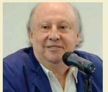
Víctor Manuel Toledo, nuevo secretario de Medio Ambiente y Recursos Naturales.

El jefe del Ejecutivo consideró la dimisión de González-Blanco como lamentable, pero "no tenemos derecho a fallar en nada"; "yo la quiero mucho", pero "cometió un error". Subrayó que la renuncia de la ahora exfuncionaria se debe a un error que "no se podía pasar" porque de lo contrario no se tendría autoridad política y por lo tanto tampoco moral para encabezar la transformación del país.