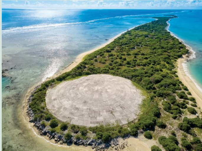
Toneladas de residuos arrojadas a un cráter sellado con cemento están en riesgo de diseminarse, ante las inclemencias de los años y el cambio climático.

Dos décadas después de la explosión de "Cactus" en la isla de Runit, el ejército estadounidense derramó en su cráter los desechos contaminados de decenas de otros ensayos. Todo fue recubierto en 1979 con una gran cúpula circular de cemento de 115 metros de diámetro y 45 centímetros de espesor.